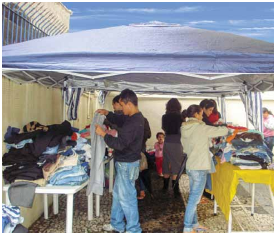
Na sede administrativa, o bazar organizado com as doações beneficiou as Mães do programa Viva Leite