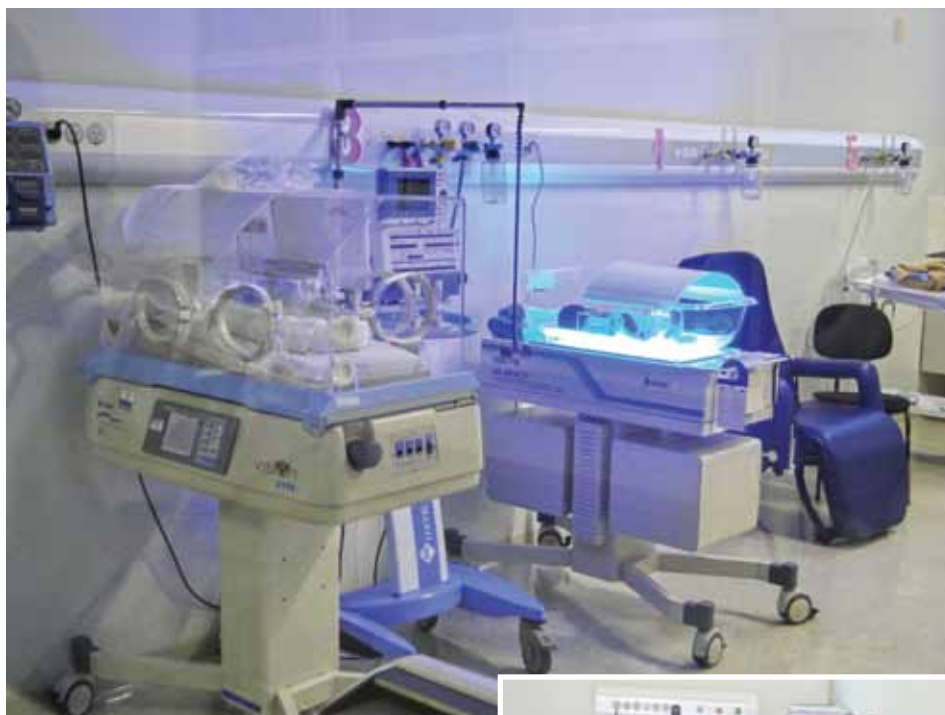
Melhorias no atendimento da maternidade já foram sentidas pela população

Entre as mudanças já implantadas, e elogiadas através do SAU (Serviço de Atendimento ao Usuário) e da Ouvidoria da Secretaria de Saúde, estão: a recepção independente do Pronto Socorro para receber as gestantes, que recebem um tratamento individualizado, a visita das futuras mães à maternidade para conhecer o espaço onde terão seus bebês, a possibilidade de contar com o apoio de um acom-