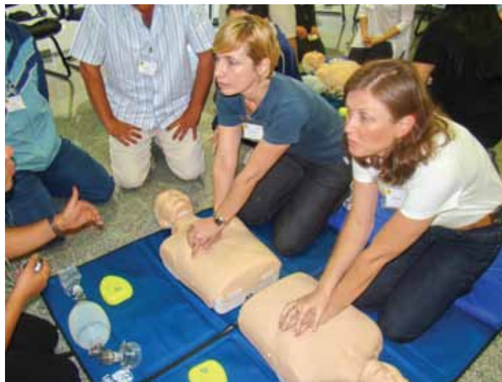
Início da capacitação dos Gerentes das AMAs sob gestão do CEJAM