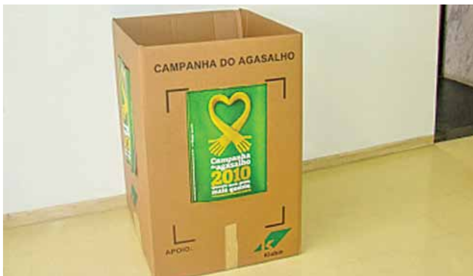
A Campanha do Agasalho 2010 realizada nas Unidades de Saúde CEJAM arrecadou 6.500 peças de roupas