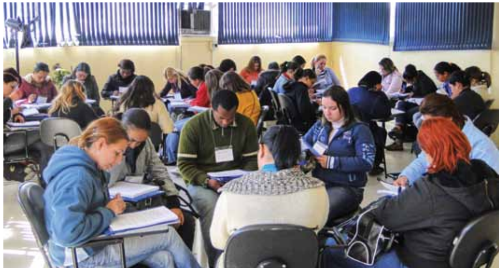
Agentes Comunitários de Taboão da Serra passaram pelo curso de capacitação

Em Mogi das Cruzes, a primeira turma de profissionais também já passou pelo curso. Agentes Comunitários, auxiliares de enfermagem, técnicos de farmácia, médicos, enfermeiros e auxiliares administrativos de sete Unidades de Saúde passaram cinco dias entendendo o funcionamento do SUS e da Atenção básica como um todo.