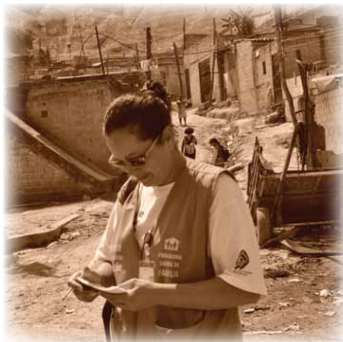
Agente Transformador altera a realidade do Bananal

Foram escolhidos para participarem da Mostra os seguintes trabalhos: capacitação sobre Momento SUS nos serviços AMA sob Gestão Direta da OS CEJAM, da AMA Jardim