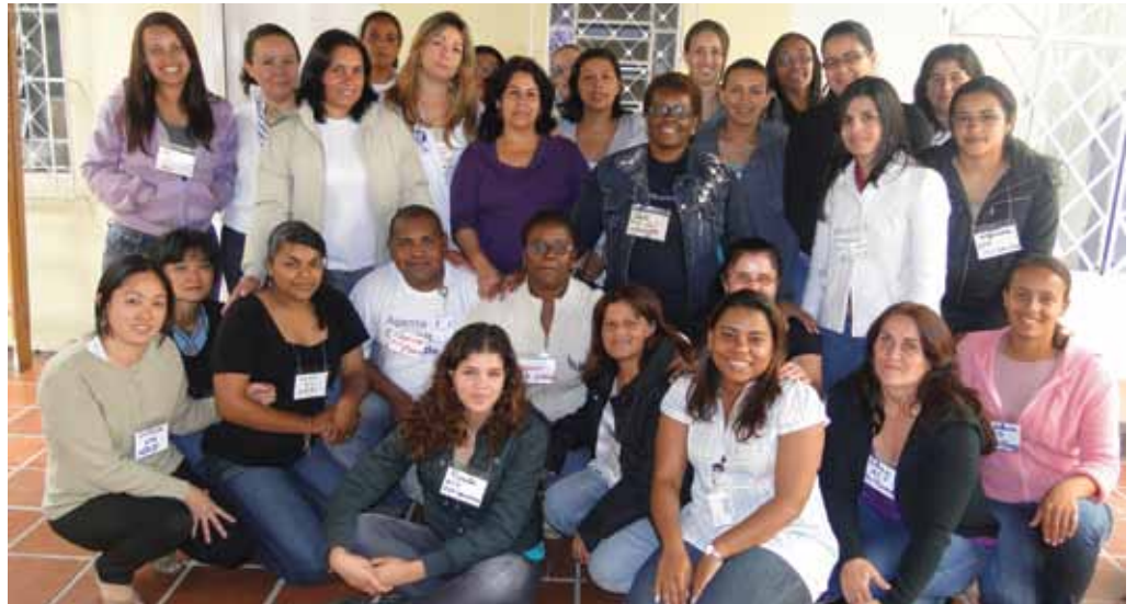
Equipe de Profissionais do Município de Mogi das Cruzes integrada e preparada para um novo trabalho