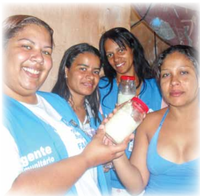
Incentivo ao Aleitamento Materno e a doação de leite