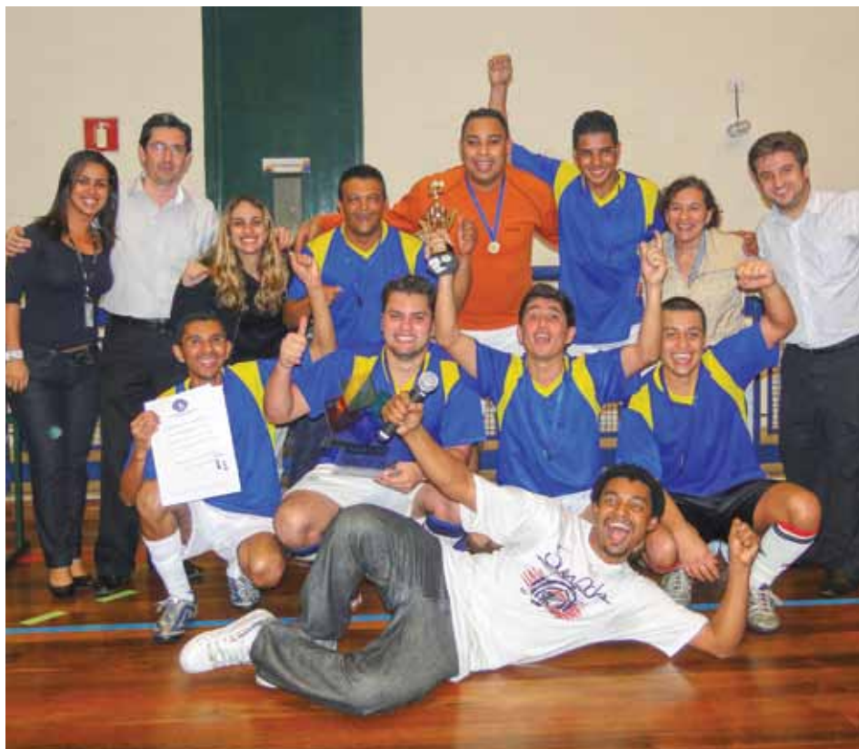
AMA Parque Fernanda foi a campeã com seis jogos e seis vitórias e levou como prêmio um uniforme completo