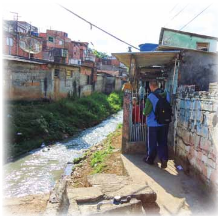
Ultrapassando as dificuldades do dia-a-dia para chegar até você