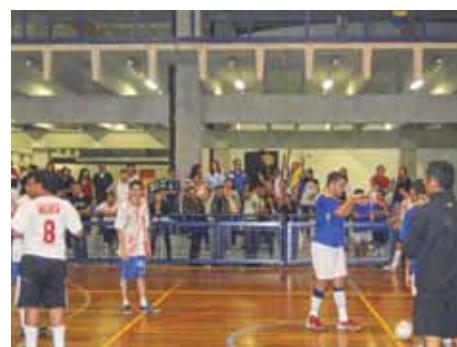
Torcida compareceu ao CEU Capão Redondo