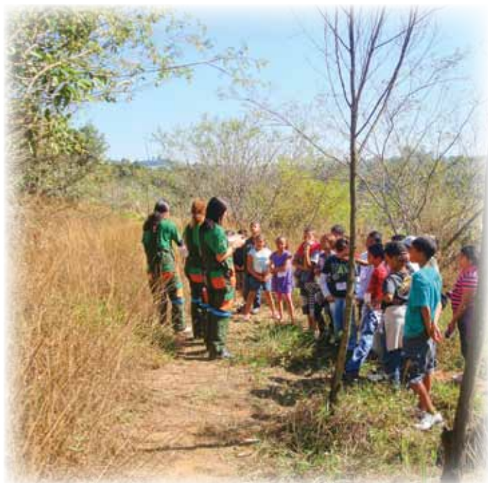
Projeto Conhecendo o Meio Ambiente PAVS Jardim Caiçara

N os dias 18, 19 e 20 de outubro, a Secretaria de Saúde do Estado de São Paulo promoverá a “I MOSTRA DE EXPERIÊNCIAS EXITOSAS DA SAÚDE DA FAMÍLIA DO MUNICÍPIO DE SÃO PAULO”. Diversos trabalhos realizados pelas Unidades de Saúde do CEJAM foram selecionados e ficarão em exposição.